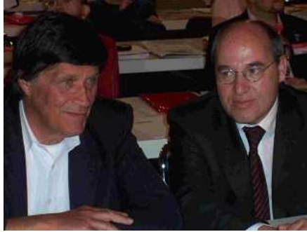
Ulrich Maurer und Gregor Gysi

Er habe noch nie so begeistert gearbeitet, sei stolz darauf, für eine Partei zu arbeiten, die Krieg als Mittel der Politik ablehne, sich gegen den Finanzmarktkapitalismus aufgelehnt, Gerechtigkeit zum Ziel habe.