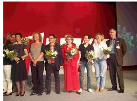
Der neue Bundesvorstand

127 Delegierte sind in einer Basisorganisation, 259 auf der Ebene des Gebietes, 119 auf Landesebene, 56 auf Bundesebene aktiv.