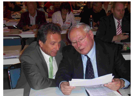
Klaus Ernst und Oskar Lafontaine

Und wir wollen auch einen früheren Ausstieg derer aus dem Erwerbsleben, die sich schon kaputt geschafft haben.